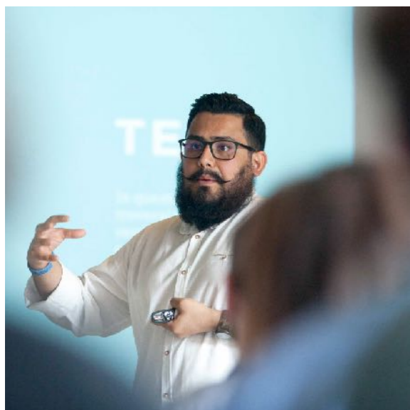
Digital Innovation Day - 2018

Siamo la scuola dell'innovazione digitale di Talent Garden